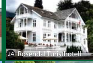
24 Rosendal Turisthotell