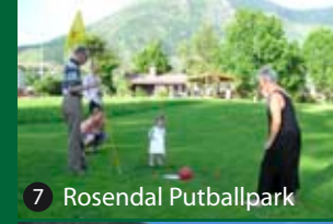
7 Rosendal Putballpark