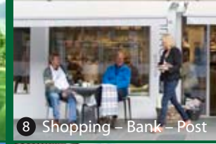
8 Shopping – Bank – Post