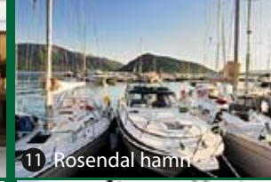
11 Rosendal hamn