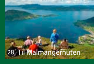
28 Til Malmangernuten